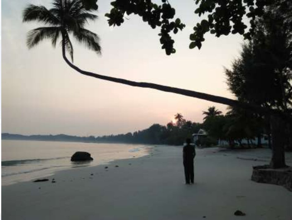
Pulau Bintan, Kepulauan Riau

"Hiduplah seolah engkau mati besok. Belajarlah seolah engkau hidup selamanya." (Mahatma Gandhi)