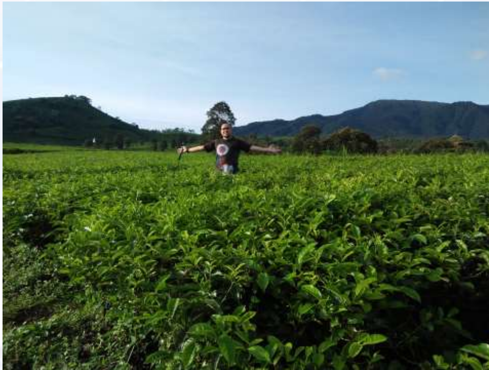
Kebun The, Garut, Jawa Barat

“Jangan takut melangkah, karena jarak 1000 mil dimulai dari satu Langkah”